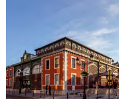
Les Halles

À l'écart de l'agitation, la ville haute a conservé ses maisons bigourdanes, son architecture d'autrefois.