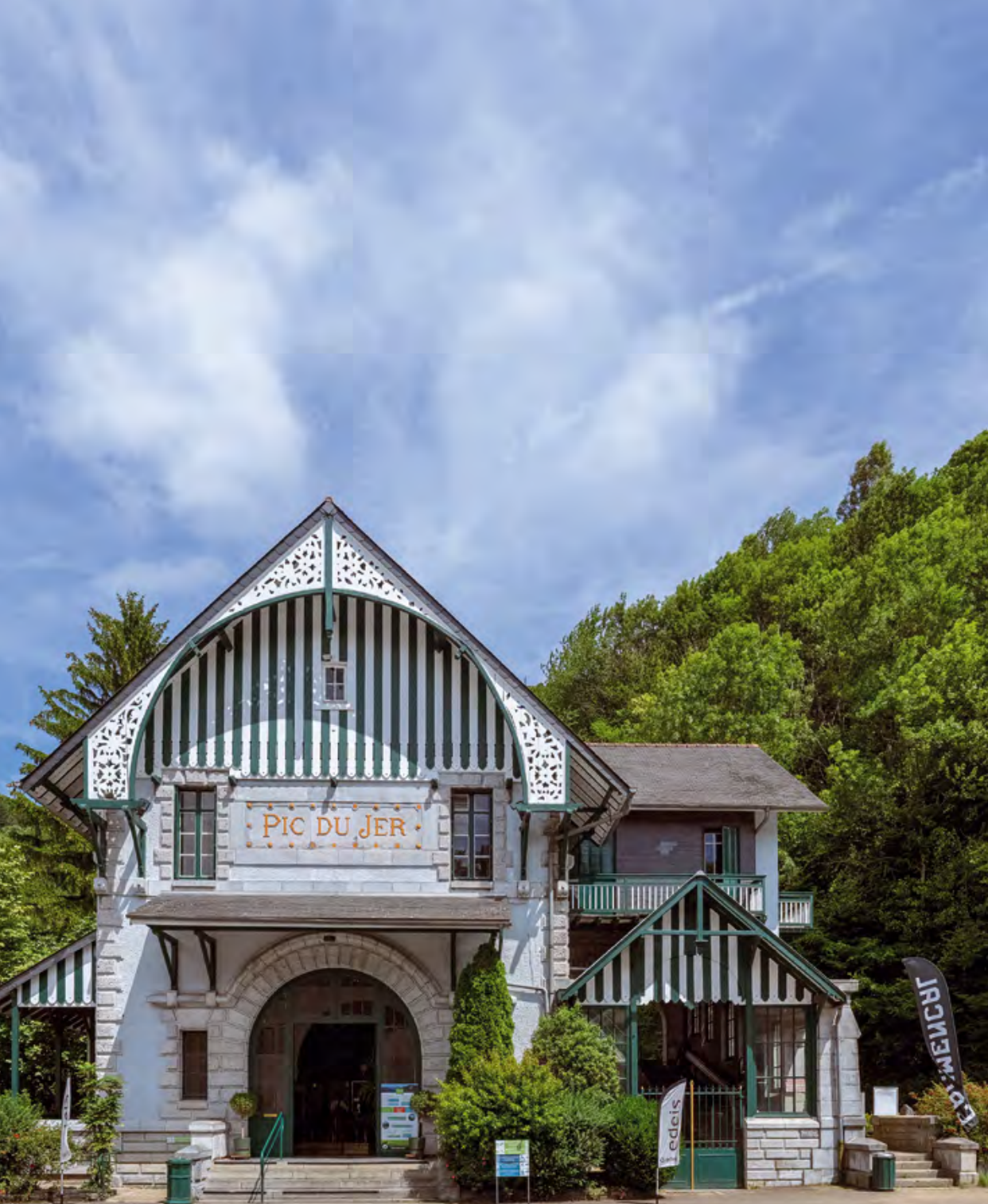
Gare du Pic du Jer

Il est des destinations que l'on croit connaître. Lourdes en fait partie. Son nom convoque des images fortes, presque évidentes. Et pourtant, il suffit d'y porter un autre regard pour découvrir une ville plus vaste, plus sensible, plus actuelle qu'on ne l'imagine.