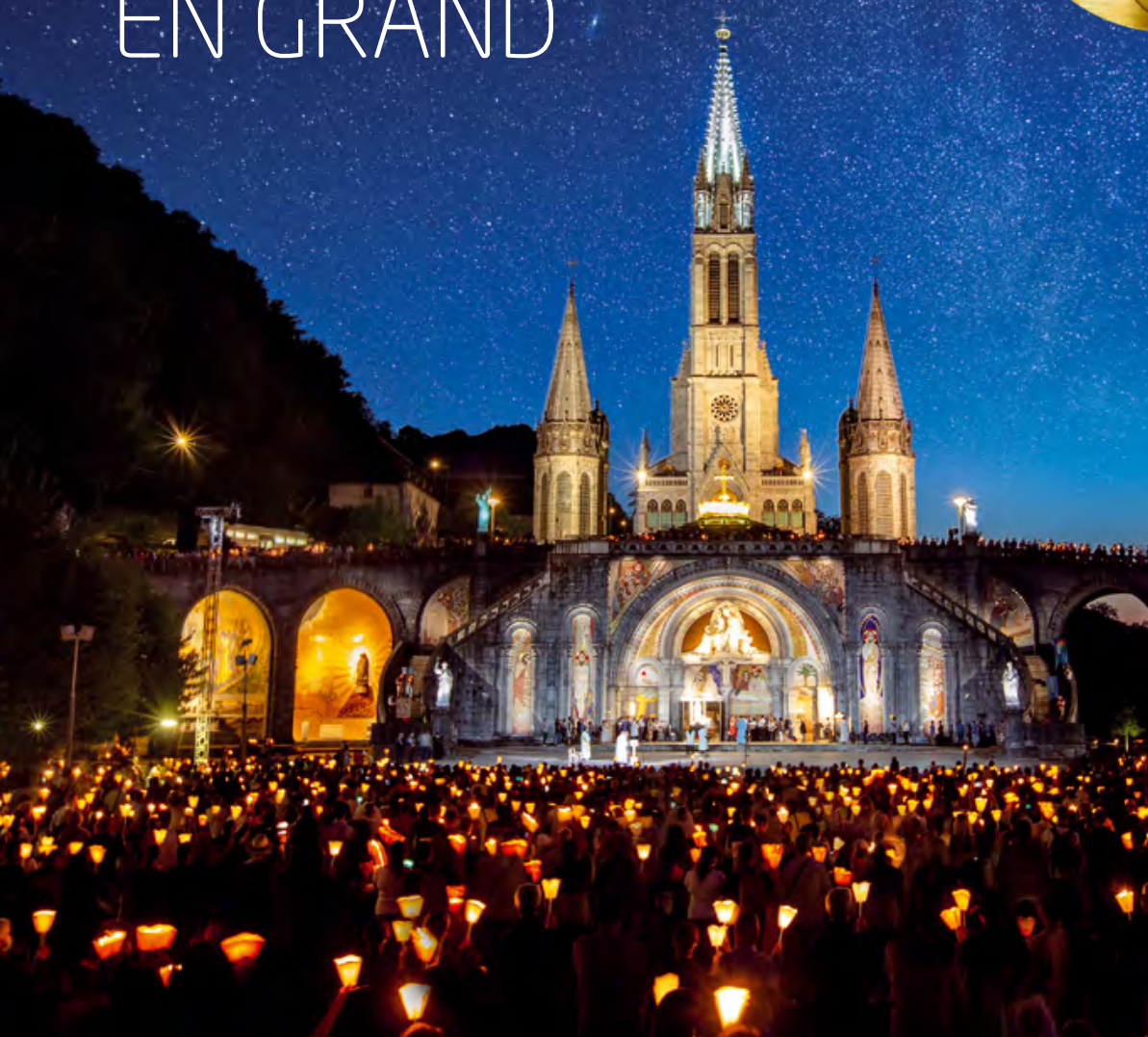
Procession aux flambeaux

Envie de se dépasser ou simplement souffler un peu et se retrouver. Lourdes, sentinelle de paix, accueille tous les cheminements et offre bien des réponses.